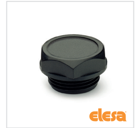
ELESA Original design TN.