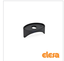
ELESA original design ADT