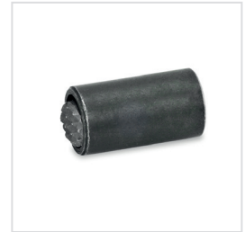
Anwendungsbeispiel verschiedener Pendelelemente mit O-Ring