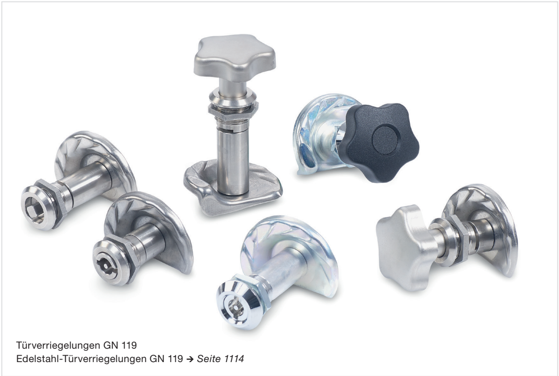
Türverriegelungen GN 119 Edelstahl-Türverriegelungen GN 119 → Seite 1114